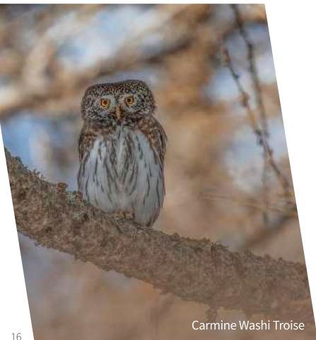
Carmine Washi Troise